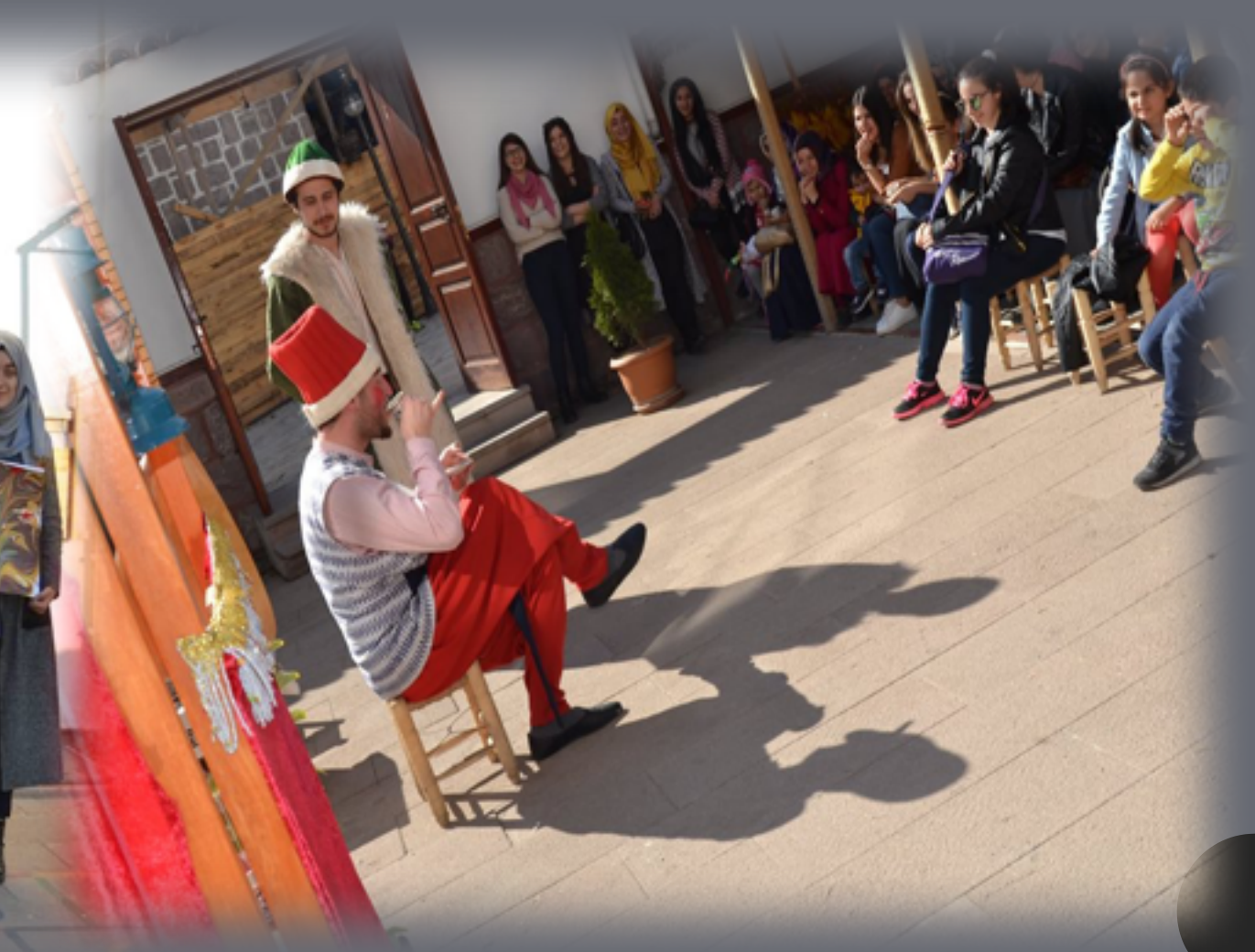
KIRK YILLIK HATIR: TÜRK KAHVESİ