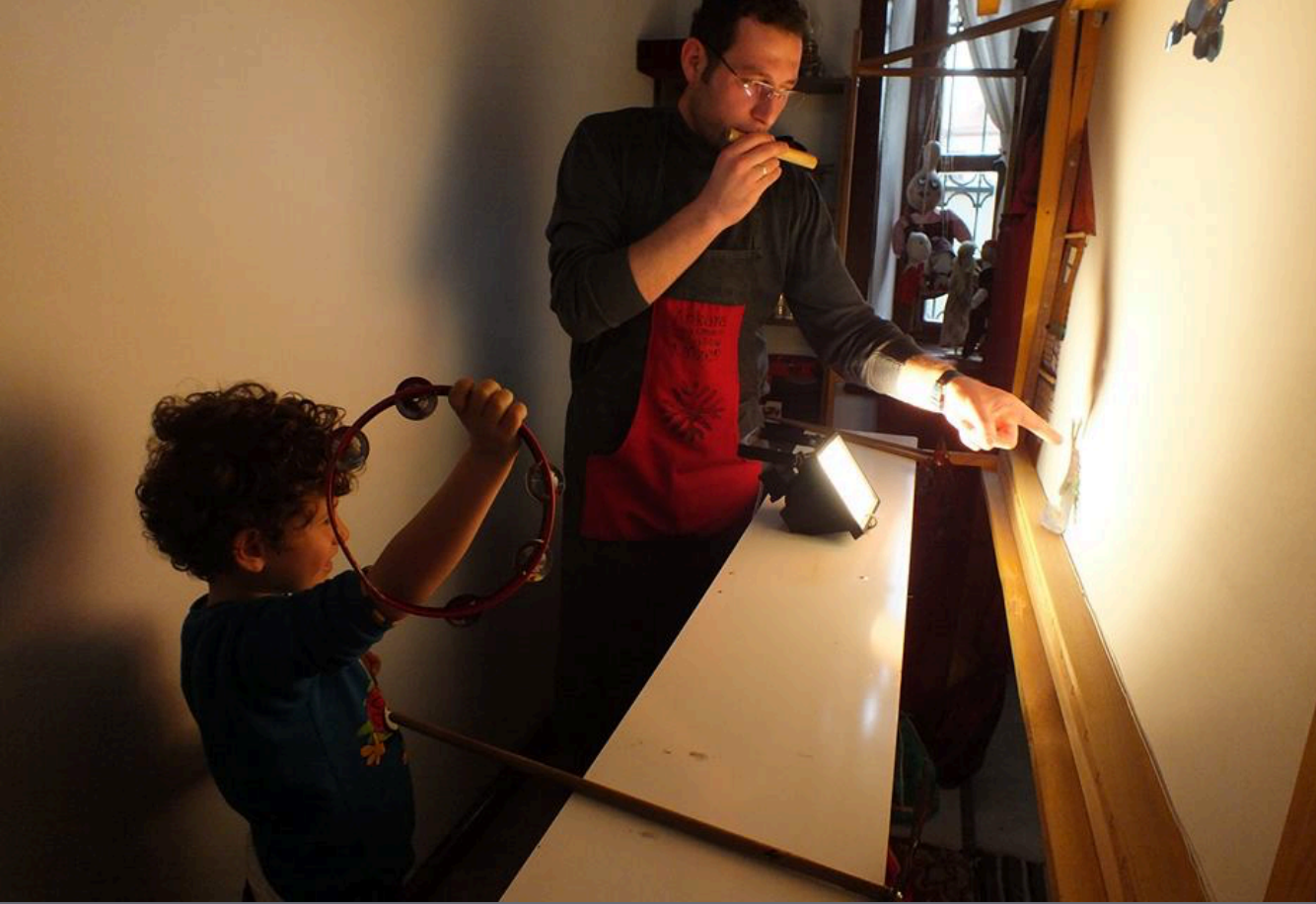
Gösteri Sanatları Atölyesi