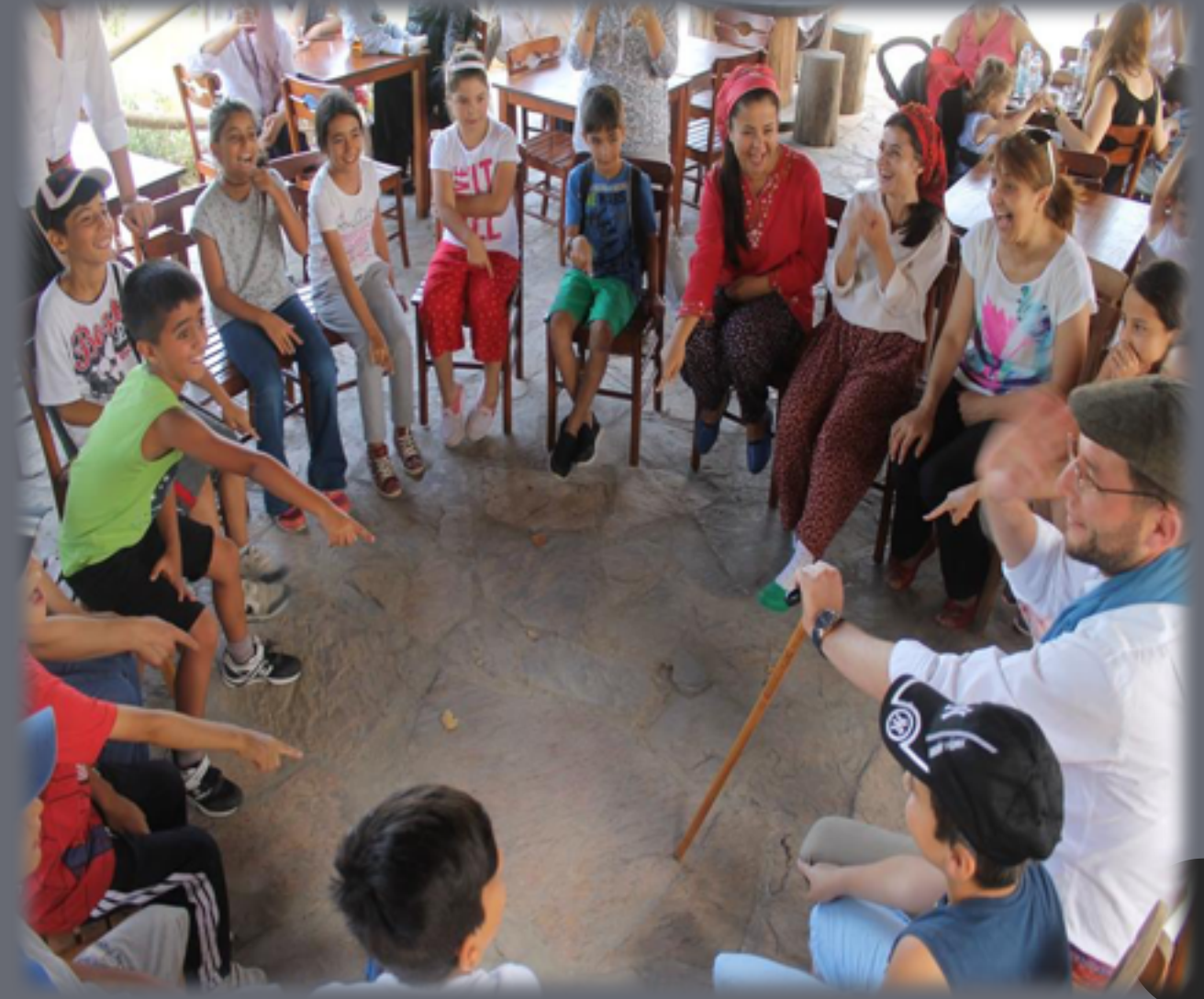
ALTINKÖY AÇIK HAVA MÜZESİ