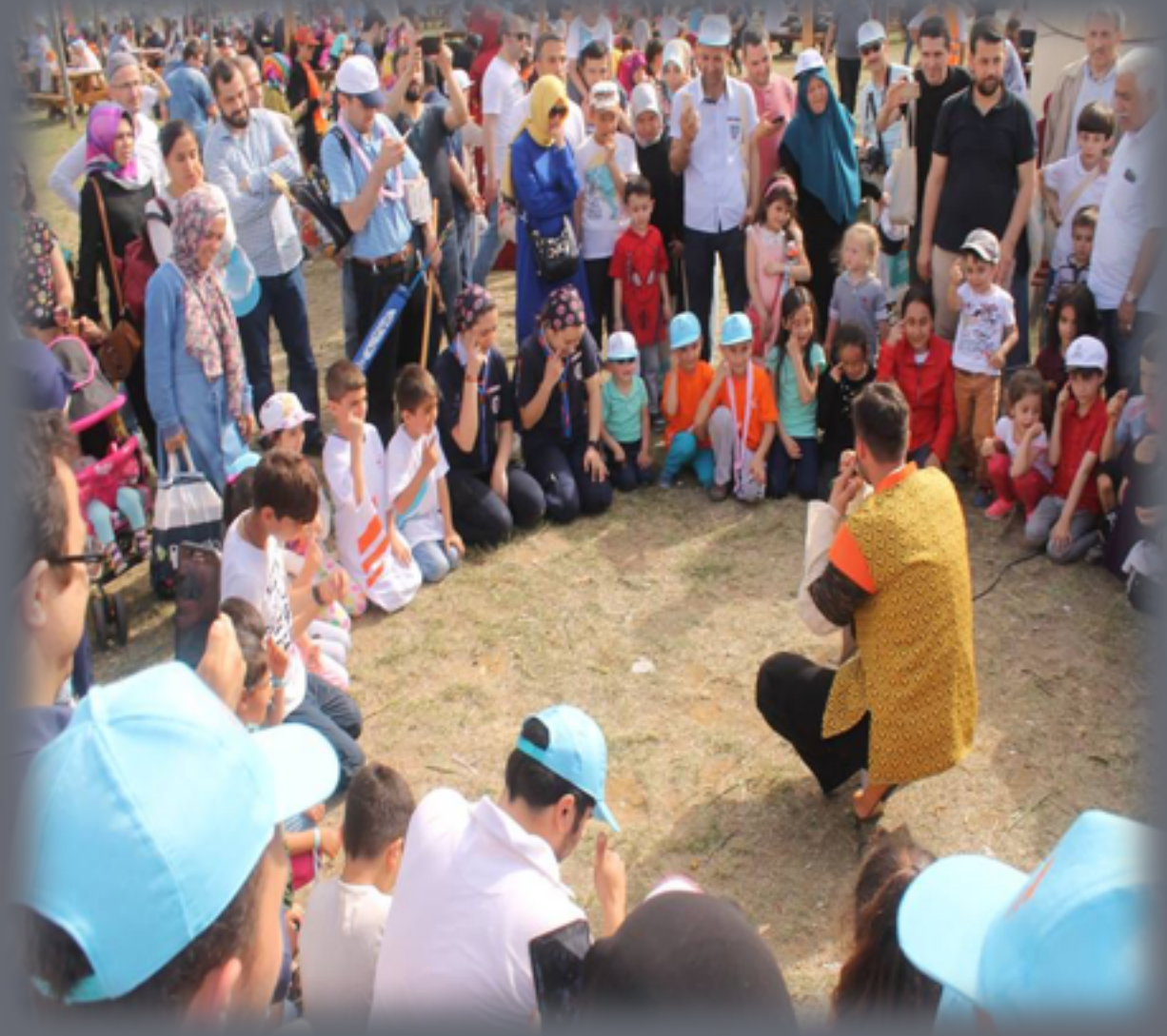
ETNOSPOR KÜLTÜR FESTİVALİ