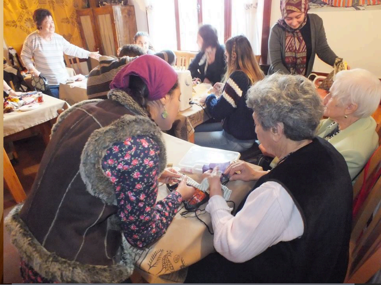
Çok Amaçlı Atölye - El Sanatları Atölyesi