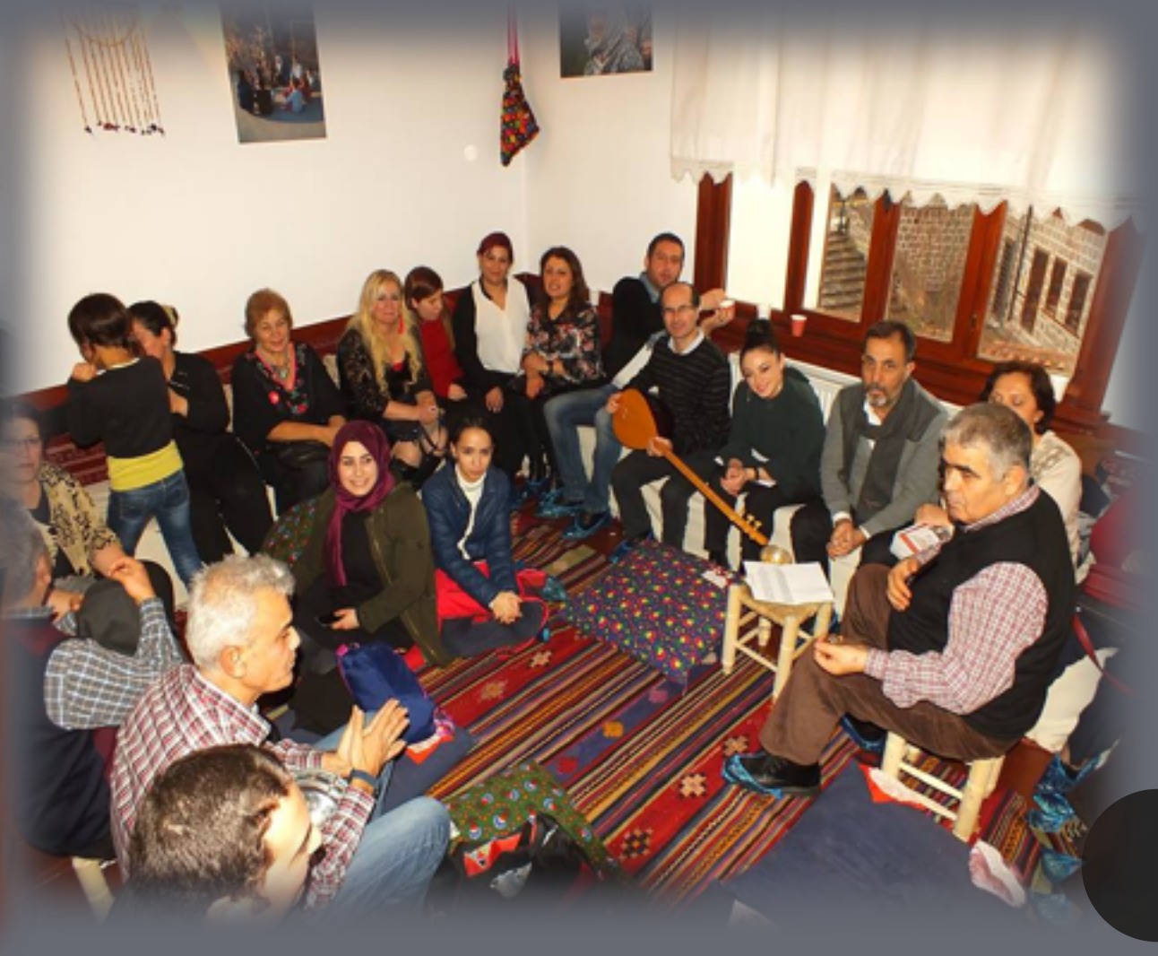
Ankara Türküleri ve Hikâyeleri