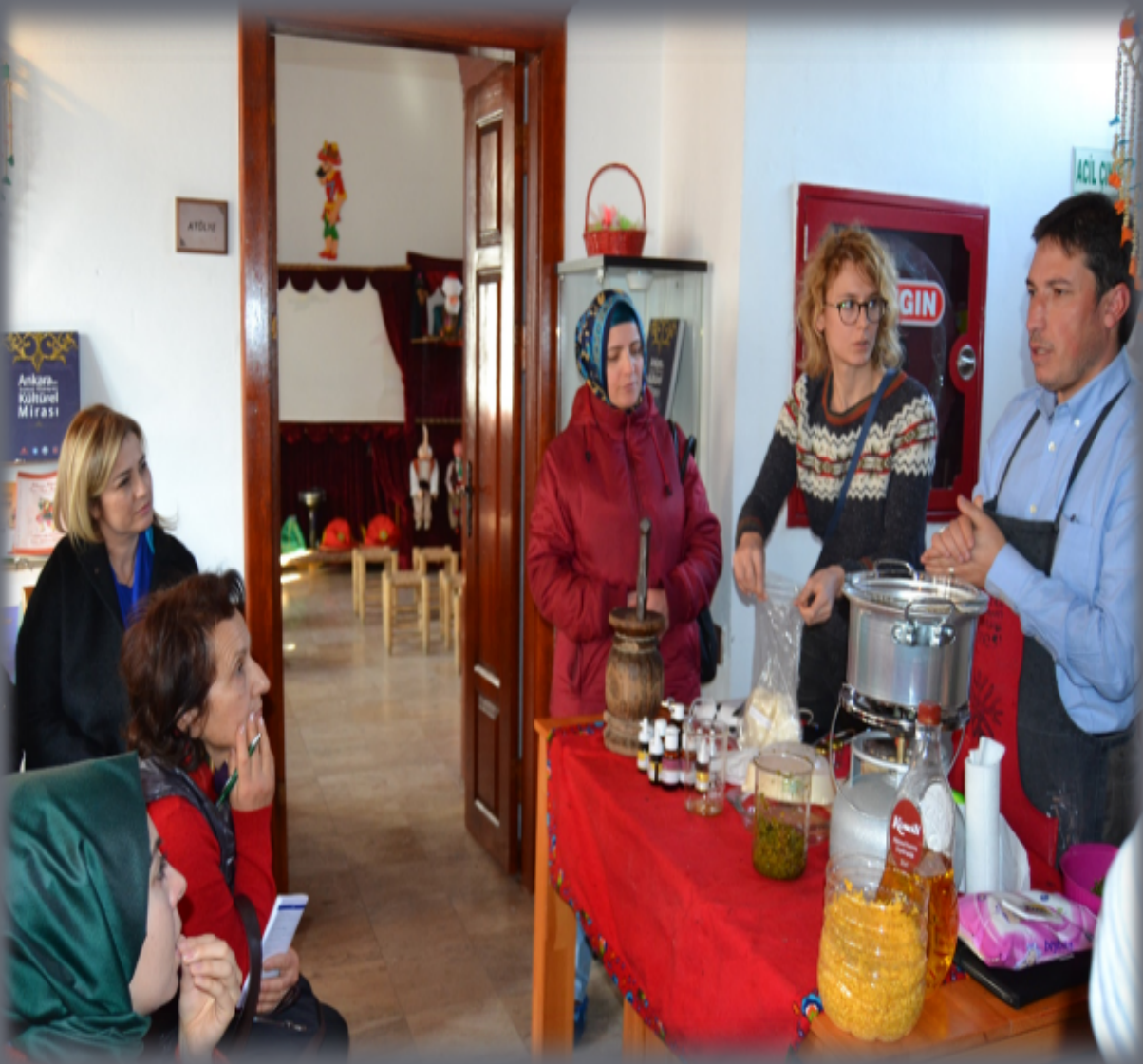
GELENEKSEL MERHEM YAPIM ATÖLYESİ