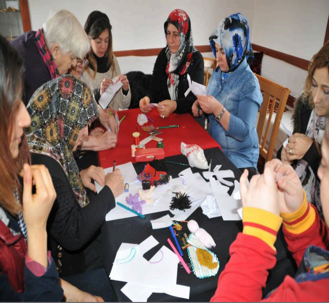
BEZ BEBEK YAPIM ATÖLYESİ