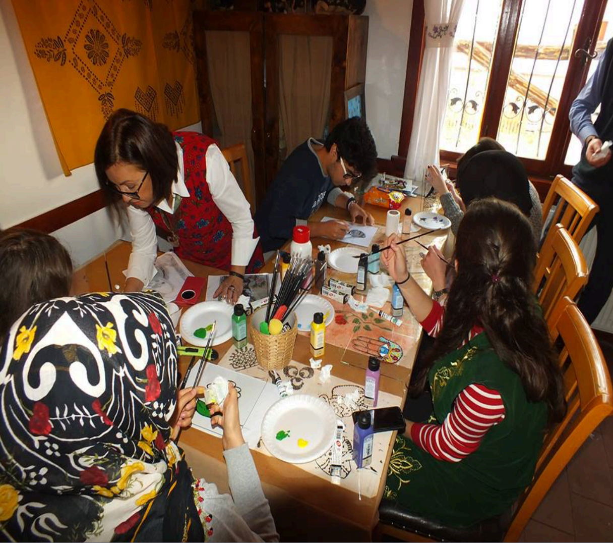
CAM ALTI RESİM ATÖLYESİ