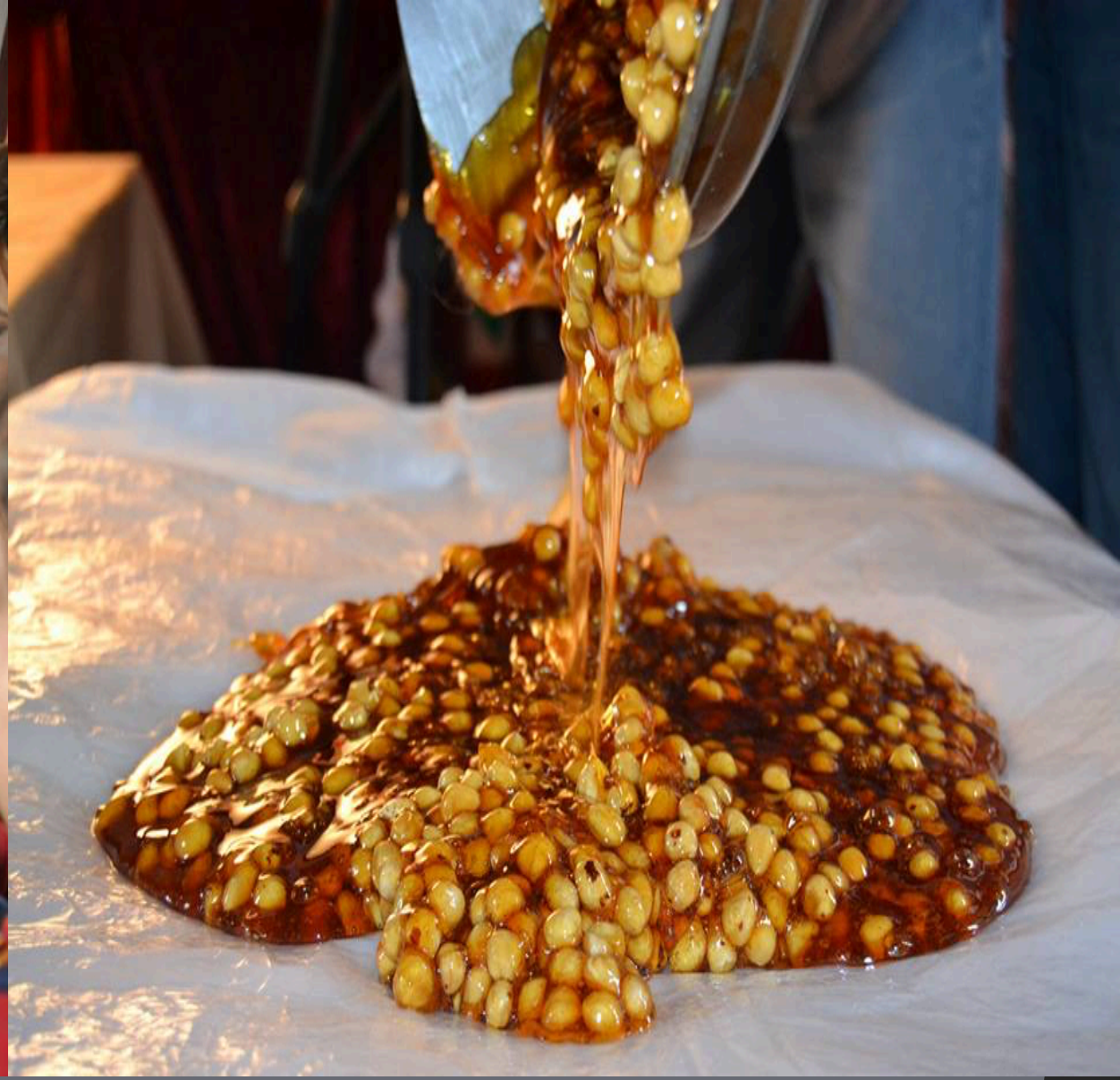
GELENEKSEL AKİDE ŞEKERİ YAPIM ATÖLYESİ