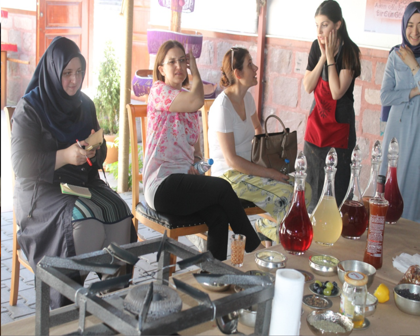
GELENEKSEL ŞERBET YAPIM ATÖLYESİ