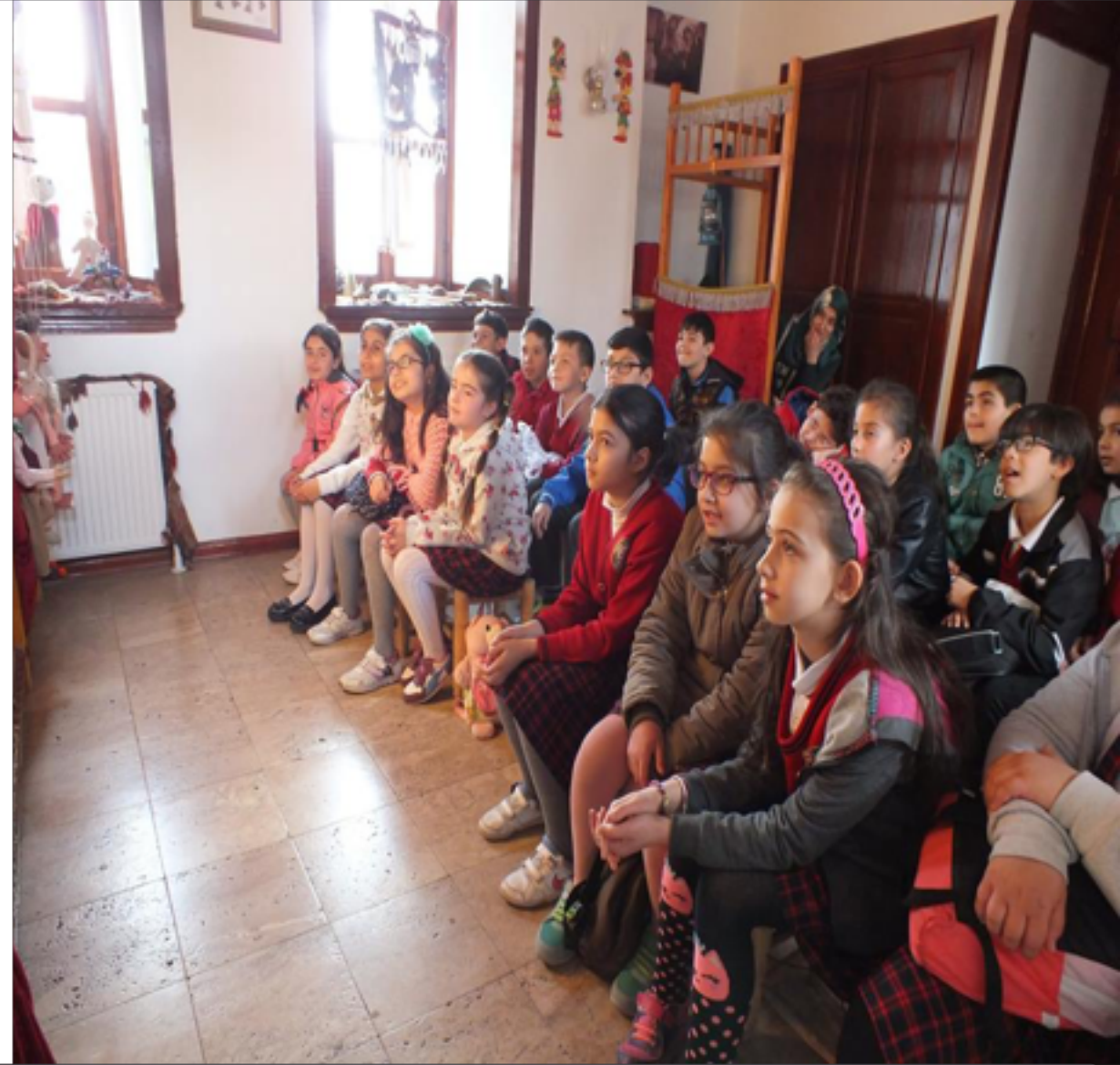
Gösteri Sanatları Atölyesi