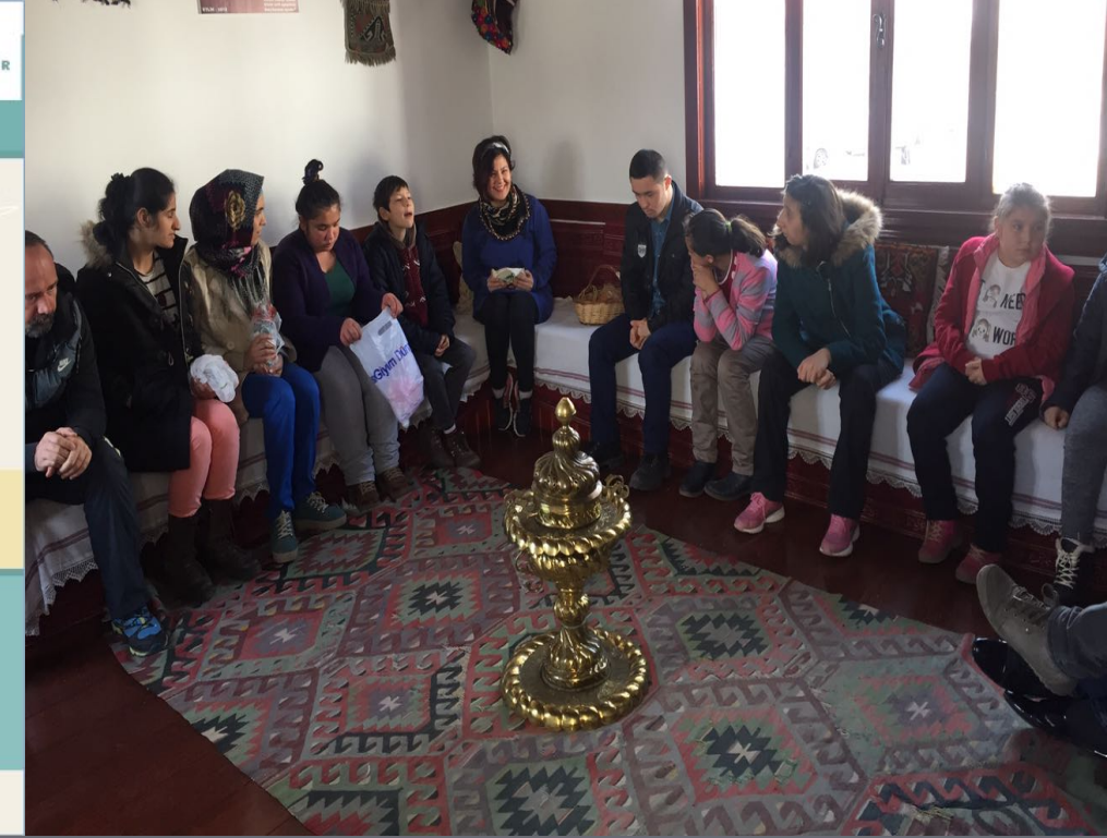
Ankara Somut Olmayan Kültürel Miras Müzesi Lösante'de